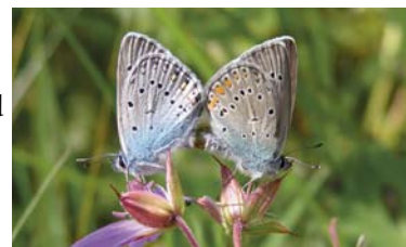
Ihopkopplade blåvingar under parningsakt.

Vill man själv föda upp fjärilar gäller det att sträva efter att ha samma temperatur och fuktighet som ägg, larver och puppor skulle levt i under normala förhållanden. Det innebär t.ex. att övervintrande larver eller puppor måste förvaras utomhus under köldperioden. Fjärilens livscykel kommer därmed i fas med årstiderna och man kan släppa ut de nykläckta fjärilarna.