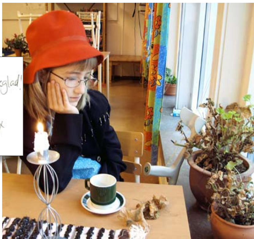
Bilden nedan visar en scen från filmen där tanten är ledsen för att hon inte har några fina blommor hemma, till vänster syns några skisser från bildmanuset.