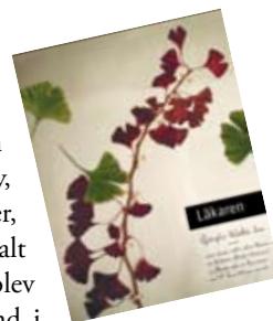
från ”Läkaren Linné – medicinens dubbla nyckel”, Carlsson Bokförlag, andra upplagan. 2006

Bilden visar dels en kvist av ginko från en tavla som finns på Linnés Hammarby, dels blad av färsk ginko. Kvisten kommer, enligt uppgift på växtarket, från ett gammalt träd i Harderwijk, Holland, där Linné blev medicine doktor. Ginko finns omnämnd i 5 000 år gamla örtaböcker från Kina. Växten anses bland annat kunna förbättra minnet. Ginko kan kallas ett levande fossil och släktet var vanligt redan för 200 miljoner år sedan. Linné har gett växten det latinska namnet.